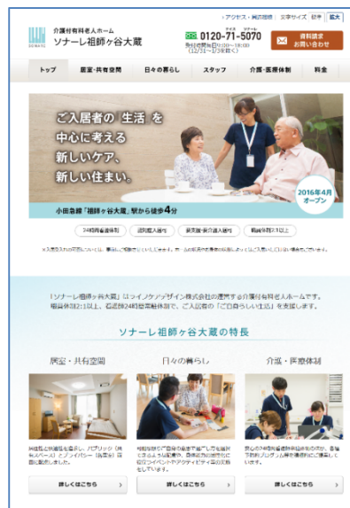
② ホーム別の新トップページ ※PCからのアクセス時