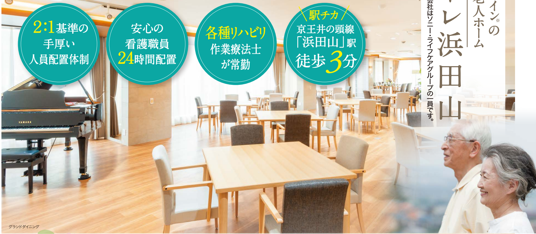
グランドダイニング