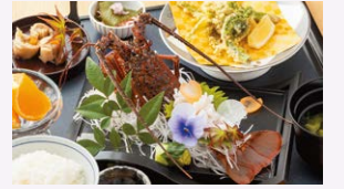
産地ブランド食材を使った昼食例