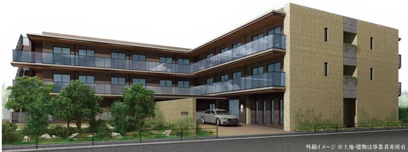
外観イメージ ※土地・建物は事業者非所有

ご希望日の前日・18時までに下記に記載のフリーダイヤルまでお電話、 または、裏面記載のおはがきにてご予約ください